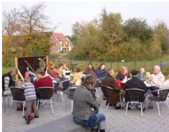
Bei schönem Wetter lädt unsere großzügige Terrasse zu verweilen ein.

Während des Cafés bieten wir ein niederschwelliges Rahmenprogramm an, das durch Information, Unterhaltung und Kultur geprägt ist. Bei all dem stehen allerdings das Gespräch und die Geselligkeit im Zentrum.